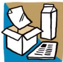
Pappír og pappi