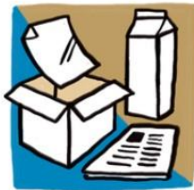
Pappír og pappi